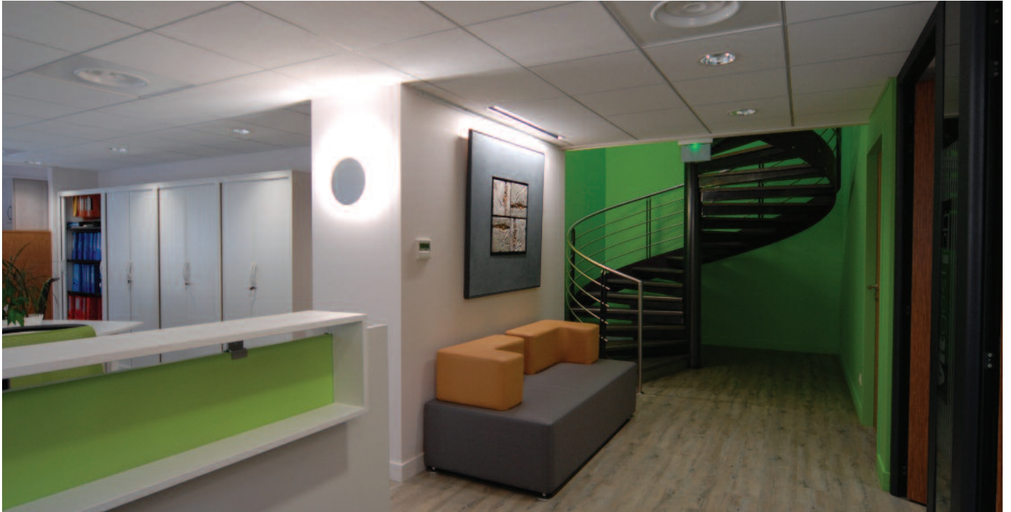
Accueil et espace d'attente