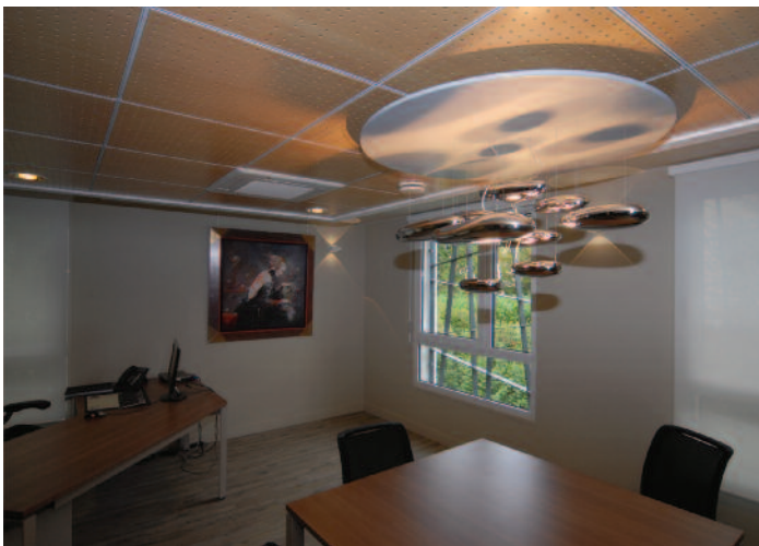
Bureau de direction