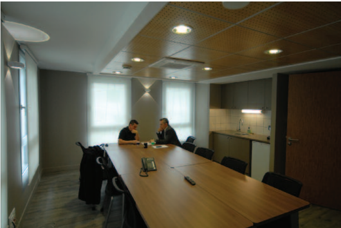
Espace salon – kitchenette